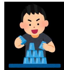
スポーツスタッキング