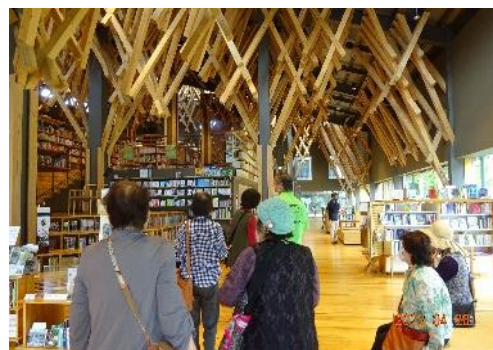
↓↓ ゆすはら雲の上の図書館